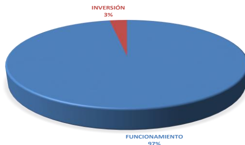
GRAFICA NO.1 DISTRIBUCIÓN PORCENTUAL POR TIPO DE PRESUPUESTO DEL PRESUPUESTO LEY- AÑO 2022

Es importante mencionar, que del monto total del Presupuesto Ley 2022, B/.126,074,773.00, es decir el 83.5% provienen de los ingresos corrientes, mientras que B/.24,857,927.00, el 16.5%, del fondo de autogestión de la Contraloría General de la República, correspondiente al cobro por el manejo de los préstamos personales otorgados por las entidades financieras a servidores públicos, como se puede ver en el cuadro No.2.