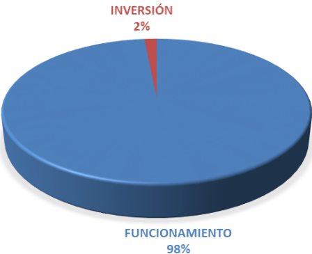
GRÁFICA NO.2 DISTRIBUCIÓN PORCENTUAL POR TIPO DE PRESUPUESTO DEL PRESUPUESTO MODIFICADO- AÑO 2024

La Institución al 31 de enero de 2024, con un presupuesto asignado de B/.18,624,295.00, muestra una ejecución presupuestaria acumulada de B/.8,472,009.00, es decir 45.5% del monto asignado a este mes.