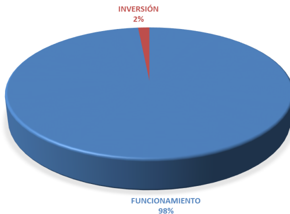
GRÁFICA No.1 DISTRIBUCIÓN PORCENTUAL POR TIPO DE PRESUPUESTO DEL PRESUPUESTO LEY- AÑO 2024