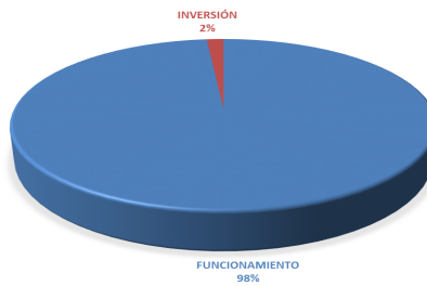
GRÁFICA No.1 DISTRIBUCIÓN PORCENTUAL POR TIPO DE PRESUPUESTO DEL PRESUPUESTO LEY- AÑO 2024

El Presupuesto Ley de la actual vigencia, fue incrementado producto de dos créditos adicionales, por B/.29,855,056.00, destinados a financiar los siguientes gastos: