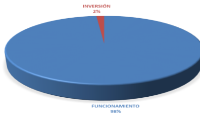
GRÁFICA No.1 DISTRIBUCIÓN PORCENTUAL POR TIPO DE PRESUPUESTO DEL PRESUPUESTO LEY- AÑO 2024

El Presupuesto Ley de la CGR para la actual vigencia, fue incrementado producto de dos créditos adicionales, por B/.29,855,056.00, destinados a financiar los siguientes gastos: