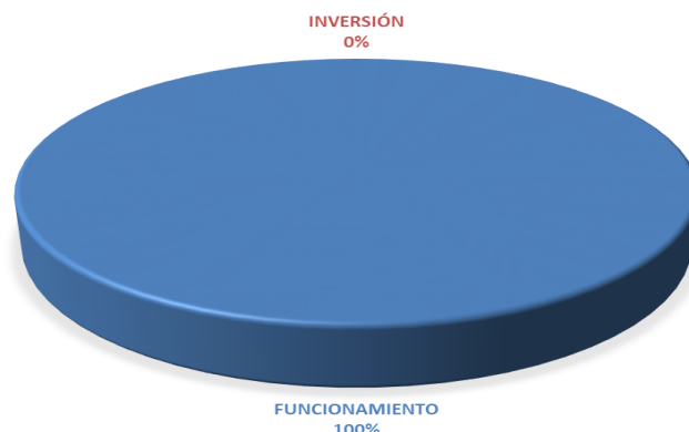
GRÁFICA No.1 DISTRIBUCIÓN PORCENTUAL POR TIPO DE PRESUPUESTO DEL PRESUPUESTO LEY- AÑO 2025

Para febrero, el Ministerio de Economía y Finanzas aplicó un traslado interinstitucional, por un monto de B/.494,000.00, a favor de la Caja de Seguro Social, sin embargo para este mes en estudio se liberaron los recursos y no se modificó el presupuesto ley de la Institución.